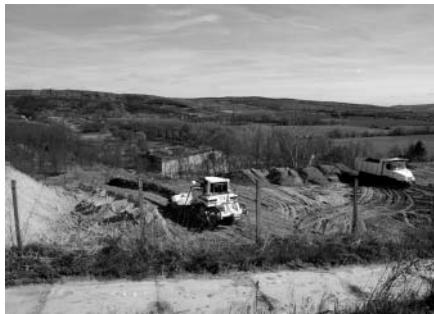
Zahájení terénních úprav v lokalitě Starých hor. V těchto místech zanedlouho vyroste sklepní ulička Starohorka.

Stroje společnosti Hochtief začaly ve středu, dne 6. března 2011, připravovat stavební plochu na výstavbu sklepní uličky Starohorka, která leží na úpatí nejlepší vinařské trati ve Velkých Pavlovicích – Staré hory. Přesun plánovaného množství zeminy by měli stavaři zvládnout během tří dubnových týdnů.