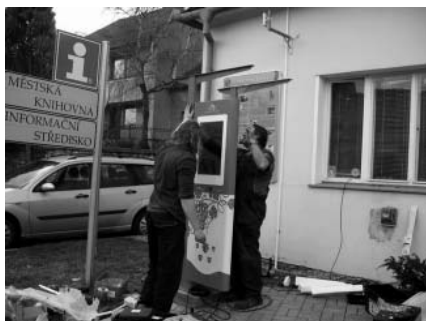
Nové informační kiosky budou pro návštěvníky praktickým pomocníkem. Doufáme, že zde najdou vždy vše dle svých představ.

Ve dnech 5. a 6. dubna 2011 nainstalovala odborná firma ve všech pěti obcích DSO Modré Hory dotykové informační kiosky. V každé z obcí tento systém představí atrak-