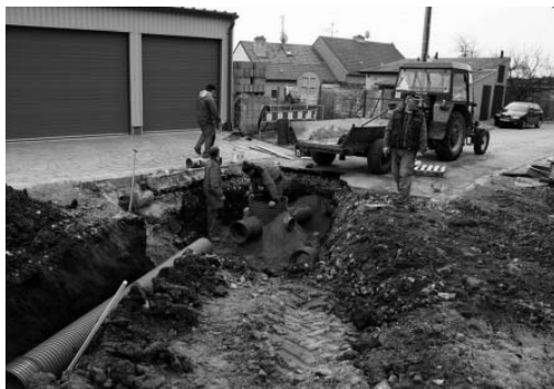
Ulice Trávníky – prodloužení kanalizace.

pracovat na prodloužení kanalizace na ulici Trávníky. Nový úsek kanalizace bude sloužit pro již započatou a plánovanou výstavbu nemovitostí v této lokalitě v souladu s územním plánem města Velké Pavlovice.