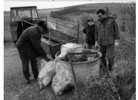
Myslivci poklízeli a vyváželi nepořádek i za pomoci traktorů. V příkopech byla k máni třeba i mikrovlnka nebo lednička.