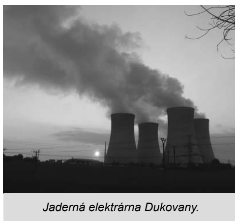
Jaderná elektrárna Dukovany.

Jak se vyrábí energie v jaderné elektrárně se vydali prověřit žáci devátých ročníků spolu se svými vyučujícími do jaderné elektrárny Dukovany. Při příjezdu je přivítalo 8 chladících věží, které chrly oblaky páry.