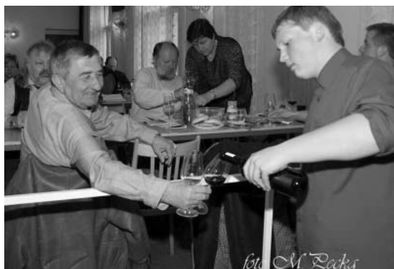
V rámci Šlapky bylo možné navštívit i košť velkopavlovických zahrádkářů. Této příležitosti využily takřka dvě stovky milovníků vína.