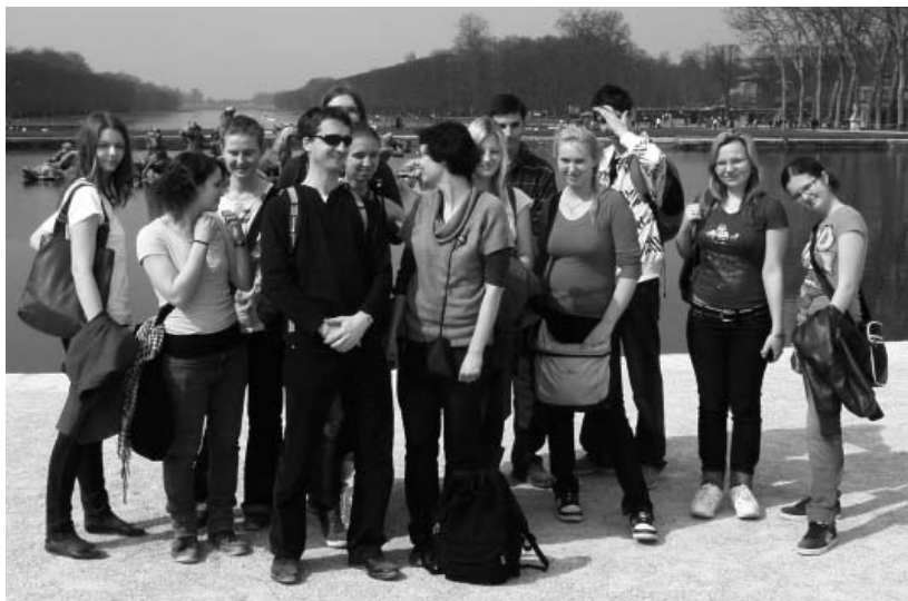
Studenti třídy 2.A velkopavlovického gymnázia na výletě v Paříži.

První zastávkou je Arc de Triomphe, neboli Vítězný oblouk, který dal Napoleon postavit na znamení své moci a vítězství v bitvách. Procházíme největším náměstím v Paříži Place de la Concorde (Náměstí Svornosti), které se nachází na pravém břehu Seiny. Uprostřed je most De la Concorde a na