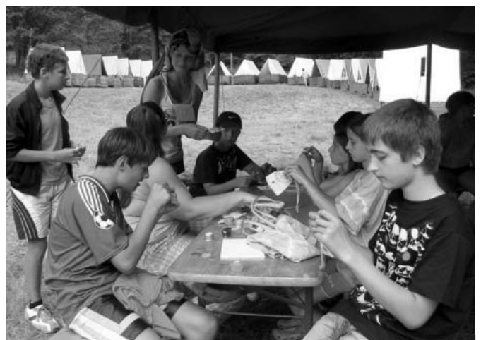
Bezva pohoda a super nálada na Morávce, z let minulých...

Již nyní se na tábor a zábavu s dětmi v lůnu horské beskydské přírody velmi těšíme!