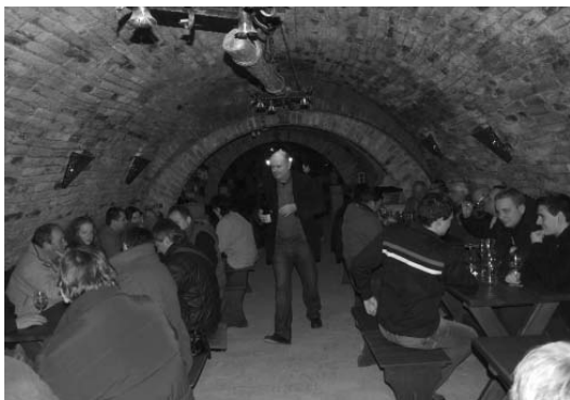
Velkopavlovičtí zahrádkáři navštívili Valtické Podzemí, za odborného výkladu si prohlédli unikátní labyrint chodeb a zúčastnili se řízené degustace vín.