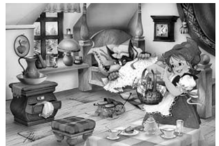
Takovou Červenou Karkulku všechny děti znají. Ty co byly v bolederadickém divadle dnes už ví, že Karkulka umí jezdit na koloběžce, nosí kraťasy a občas taky zlobí ☺!

Na pohádkové představení O červené Karkulce se v neděli, dne 20. března 2011, vypravilo 50 dětí se svými maminkami, tatínky či babičkami. Výlet do divadla v Boleradicích připravil Dámský klub s Městskou knihovnou Velké Pavlovice. Velký podíl má také velkopavlovická mateřská školka a její paní učitelky, protože divadelní pohádka byla tentokrát určena především dětem předškolního věku.