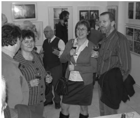
Setkání se senickými fotografy a videokameramany se neslo na vlnách pohodové nálady.