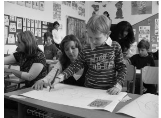
Školička se dětem velmi líbila, zkusily si „velkou školu“ tak trošku „nanečisto“. Jak? No přeci na jedničku s hvězdičkou!