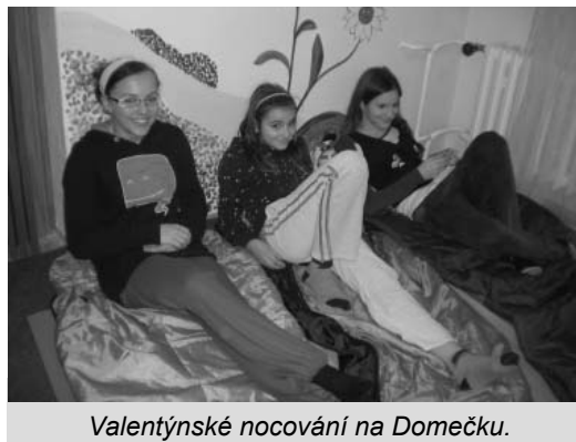
Valentýnské nocování na Domečku.

Slavilo se rozličnými způsoby. Na programu nechyběly napínavé a zábavné deskové hry, překvapení v podobě nočního vypouštění lucerniček přání na kopečku s názvem Floriánek, chutná večeře v podobě křupavých toustí-