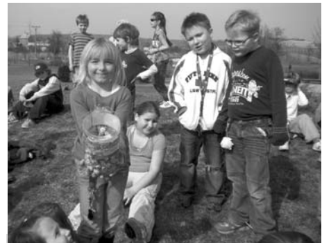
Je libo ochutnávka ze sladkého pokladu?

V cíli trasy dostali soutěžící ještě bojový úkol, a to nalézt v lesoparku ukrytý sladký poklad a posléze co nejrychleji vyluštit přichystanou křížovku. Co myslíte, vyluštili kvíz a dostali se tak k hromadě laskomin? Jednoznačně ano!