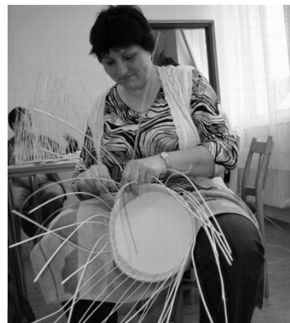
Pod rukama dam z Dámského klubu vznikla spousta krásných pedigových košíků, dekoračních nádob i praktických doplňků domácnosti.

V sobotu 19. března 2011 v 9 hodin ráno se v klubovně Dámského klubu sešlo třináct dívek a dam, aby se zdokonalily