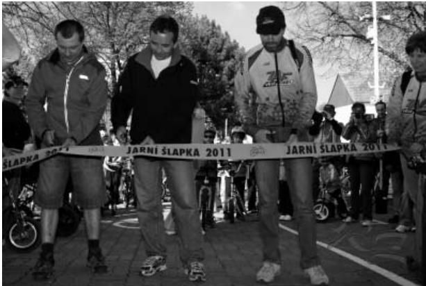
Slavnostní přestřížení pásky k turistické sezóně 2011 – tak tedy vzhůru ke krásným zážitkům.