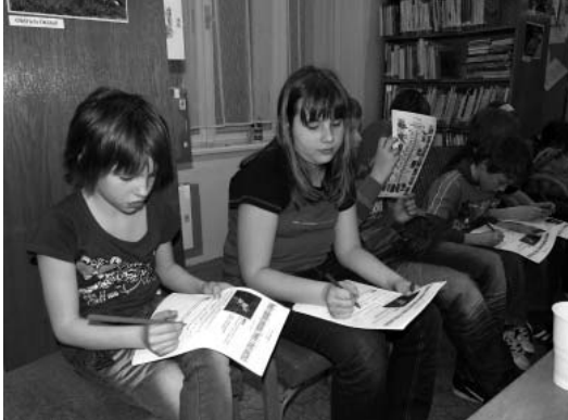
Řešení zábavných, ale i naučných kvízů – jeden z mnoha úkolů, které zvládli malí čtenáři na jedničku s hvězdičkou.

proč se Děvičkám říká právě Dívčí hrady? Nebo víte, jak přišli Lichtenštejn k zámku v Lednici a ke svému jménu? A že ten brněnský drak není tak úplně drak? Když se zeptáte dětí z Noci s Andersenem, tak Vám to určitě všechno řeknou.