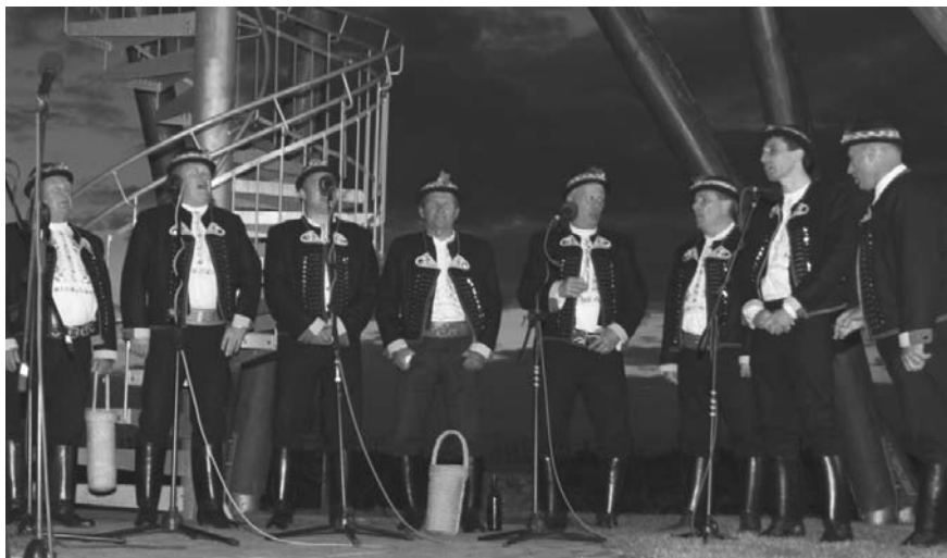
Vystoupení modrohorských mužáckých sborů bude jistě příjemnou tečkou za Májovým putováním po Modrých Horách.

II. ročník Přehlídky modrohorských Mužáckých sborů nabídne návštěvníkům vzácný kulturní zážitek, kdy si budou moci poslechnout uchvacující mužácký zpěv a melodicky překvapivé písně, tak typické pro tuto oblast. Mimo mužské pěvecké sbory bude dalším typickým prvkem cimbálová muzika z Mistrína, která se postará o tu pravou atmosféru před začátkem zpívání i v následné besedě u cimbálu. Vrcholem pak bude společný zpěv všech pěti sborů, který možná otestuje i statiku rozhledny.