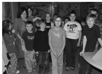
Také díky Dominu si užily tyto děti nádhernou Noc s Andersenem mezi regály knih a ve školních budovách.