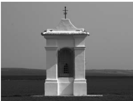
Kaplička sv. Antonína Paduánského – vítěz soutěže O nejlépe opravenou památku JMK 2011.

O výhře jsme byli informováni na apríla, tedy 1. dubna 2011, ale ani na chvíli jsme nezapochybovali o věrohodnosti této informace, neboť jsme celý měsíc prostřednictvím webových stránek města i jiné propagace tzv. „masírovali“ veřejnost s prosbou o zaslání hlasu a také jsme bedlivě sledovali na webových stránkách JMK, jak si vedeme. Všem, kteří jste naši výzvu vyslyšeli a zapojili se, velmi děkujeme!