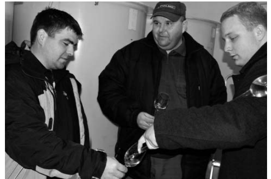
Modrohorská vína ročníků 2009 a 2010 zachutnala. Účastníci exkurze ve Vinařství Mikulica neskřývali uznání a nešetřili chválou.