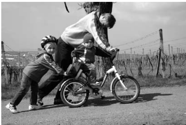
Šlape nám to o sto šest, na kole i pěšky!

Farní dvůr zval k prohlídce dřevěných soch v nadživotní velikosti, které věnovali našemu městu řezbáři z loňského I. Mezinárodního řezbářského sympozia ve Velkých Pavlovicích.