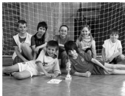
Vítěz mladší kategorie – třída 3.B

V pondělí, dne 28. dubna 2011, se žáci prvního stupně ZŠ ve Velkých Pavlovicích sešli k závěrečným finálovým zápasům v kopané. Tyto zápasy byly vyvrcholením dlouhodobé soutěže mezi jednotlivými třídami.