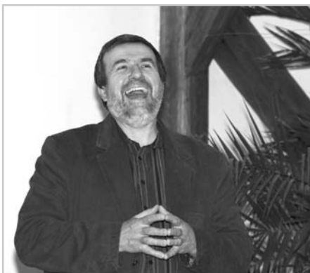
Vlastimil Vondruška své naslouchající fanoušky zaujal a pobavil, potažmo, i sám sebe. Beseda se nesla na vlnách nekonečné pohody...

Vlastimil Vondruška napsal téměř 50 knih, Městská knihovna Velké Pavlovice jich svým čtenářům může nabídnout třicet tři.