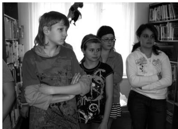
Žáci sedmých ročníků na návštěvě městské knihovny – tentokrát byla cílem jejich exkurze výstava fotografií.

Prohlédnout si výstavu znamenalo nejenom knihovnou proběhnout, ale společně s knihovnicí měly za úkol se nad fotkami zastavit, přemýšlet o jejich obsahové, výtvarné i technické stránce, dělat si vlastní názor a hlasovat pro svého vlastního „foto-favorita“.