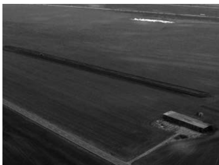
Úprava terénu letiště ze země i ze vzduchu.