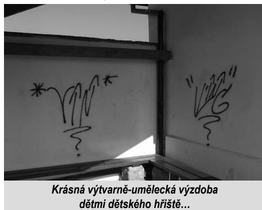
Krásná výtvarně-umělecká výzdoba dětmi dětského hřiště...

Poškození veřejného majetku není až tak zcela výsadou mládeže vracující se z diskotéky, ale i dětí mnohem mladších – školou povinných. O tom jsem se přesvědčil při zjišťování ničitele zdi areálu Moravské Agry na