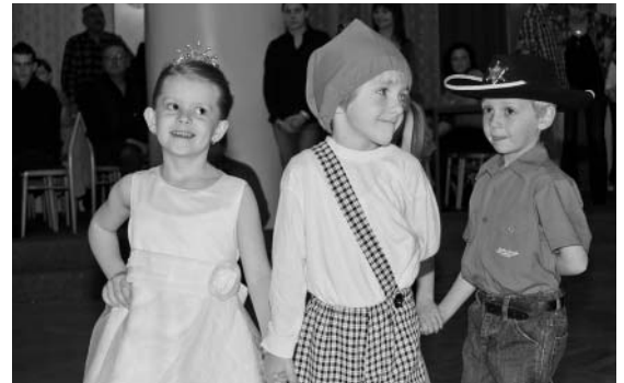
Country bál začal nefalšovanou Trpasličí svatbou a pokračoval strhujícím vystoupením Přátel country, zkrátka a dobře, zábava na jedničku!