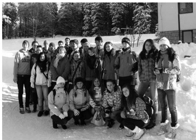
Studenti vyššího stupně Gymnázia Velké Pavlovice na lyžařském výcviku v Krkonoších.

Zbylé dny jsme vesměs trávili na sjezdovce. Padal sníh a lyžování se stávalo těžším a těžším. Ke konci kurzu se projevovala i únava.