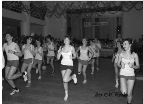
A samozřejmě ani bez půlnočního překvapení. Letos bylo opravdu nečekané, studenti si vyzkoušeli, jak si rodiče užívali na pravé Československé spartakiádě!

nebylo místo. Každý se soustředil jen na to, aby ze sebe vydal to nejlepší a aby hlavně nic nepopletl. Nakonec se vše povedlo tak, jak si každý z nás v duchu přál, a po naší polonéze nezůstalo jedno oko suché.