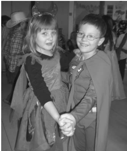
Smím prosit? Na maškaráku tančili čertice i supermani!

Mladších žáků ZŠ navštěvujících převážně I. stupeň se sešla ohromná spousta a tak se třídy družiny hemžily roztodivnými postavkami z pohádek, večerníků, hororů, ale i ze zvířecí říše. A všichni se bez rozdílu výborně bavili. Paní vychovatelky si pro děti připravily řadu veselých soutěží, sladké odměny a navybíraly skvělou taneční hudbu.