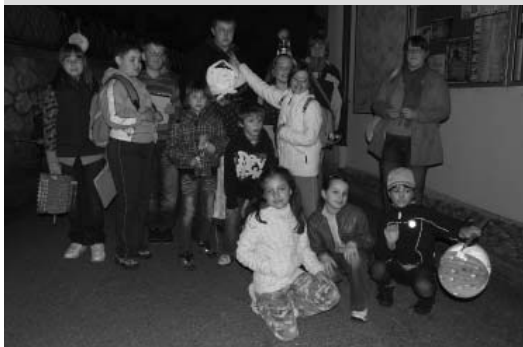
Knihy, pohádky, pověsti, divadlo, spaní v budově školní, ale i pranostiky s vynášením Smrtky ze vsí – to vše byla letošní kouzelná Noc s Andersenem.

Po pověstech si vzala slovo paní knihovnice a seznámila děti s řadou zvyků a obyčejů jako je Masopust a především tradice spojené s vítáním jara. Vyvrcholením celého programu bylo nastrojení Morany, kterou jsme potom odnesli spálit a utopit do Trkmanky. Celou cestu šly děti s rozsvícenými lucerničkami a říkaly básničku, kterou se v knihovně naučily. Více jak dvouhodinový program v knihovně byl tím krásně zakončen a my se vydali do školy, která se stala pro letošní rok naším nocležištěm. Taky už nám vyhládlo a tak jsme si dali lehkou večeři. O půlnoci nás čekala stezka odvahy, a protože ani škola nejde v noci spát, objevují se v ní tzv. pedagogická strašidla a především zmučení žáci (v podání žáků devátých ročníků). A tak se děti vydaly na cestu, která však byla zakončena jak jinak než truhlicí s pokladem. A co v ní bylo? No co jiného než krásná kniha plná pověstí. Pak