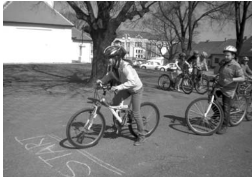
Cyklotrénik se pátákům vydařil, i počasí jim hrálo do karet!

Pod rukama šikovných holčin přišlo po zhruba dvou hodinách na svět devět hezkých zvířátek. Děvčata odcházela z Domečku spokojena a doma se jistě nezapomněla se svým „květináčkovým“ zvířátkem pochlubit. Vězte, bylo čím! Zvířátka se vsuktu moc povedla a věříme, že dnes zdobí nejen „slečnovský“ pokojíček.