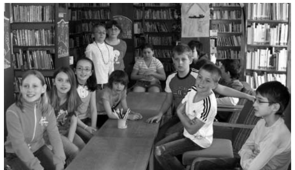
Třetáci byli programem v knihovně nadšení!