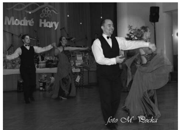
Vzpomínka na nádherný ples Modrých Hor.