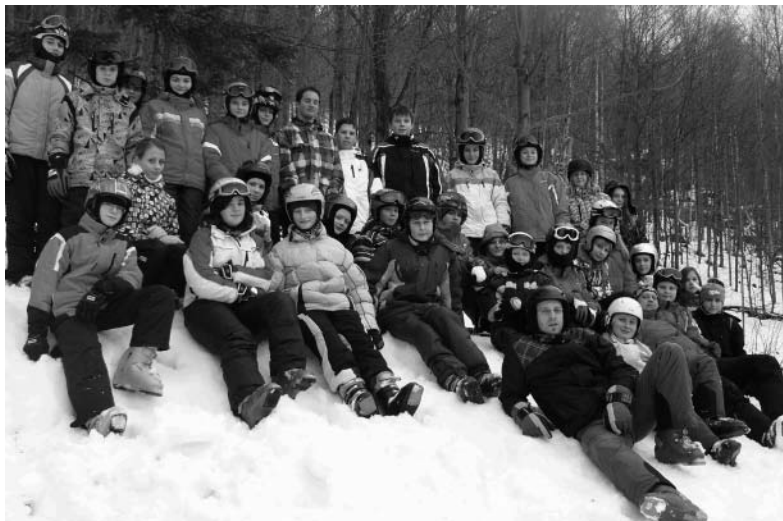
Studenti nižšího stupně Gymnázia Velké Pavlovice na lyžařském výcviku v Jeseníkách.

Po večeři následoval denní rozkaz, na kterém jsme se dozvěděli spoustu důležitých informací. Potom jsme dostali až do večerky,