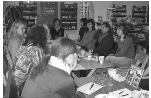
Setkání referentů turistických informačních center Pod Pálavou v mikulovském infocentru.