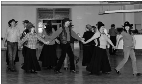
Soustředěné dopilování jemných detailů tanečních kreačí...Přátelé country prostě tančit umí!

vebního úřadu, služeb města, archivu a služebny městské policie. Okna dodala firma Pramos, a. s. Šitbořice a zapravení špalet a opravy stěn provedli pracovníci služeb města.