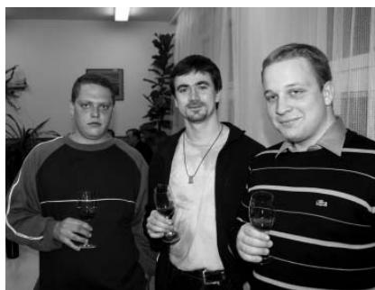
Mladá generace velkopavlovičských vinařů si již se znalostí svých otců a dědečků nezdává. Vínu skutečně rozumí.

K degustaci byly připraveny vzorky bílých, růžových a červených vín jak v odrůdách, tak ve směsích. Hlavním námětem posouzení a diskuse bylo to, jak se vinaři podařilo skloubit jedinečnou aromatickostí typickou pro ročník 2010 a zároveň také vysoký podíl kyseliny vinné i jablečné ve víně.