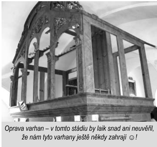
Oprava varhan – v tomto stádiu by laik snad ani neuvěřil, že nám tyto varhany ještě někdy zahrají ☺!