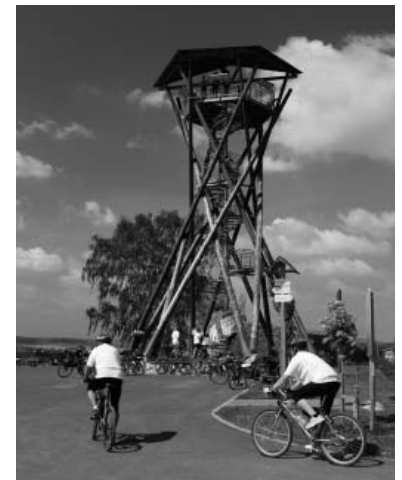
Rozhledna Slunečná v obležení návštěvníků ... na kolech i pěších.

Tyto se veřejnosti letos poprvé otevřely v rámci akce JARNÍ ŠLAPKA 2011 (16.4.2011) a poté zde bude pravidelně otevřeno od měsíce května do června vždy od sobotách a nedělích od 10.00 do 19.00 hod.. Prázdninový provoz bude stejně jako v loňském roce denně, otevírací doba bude včas upřesněna.