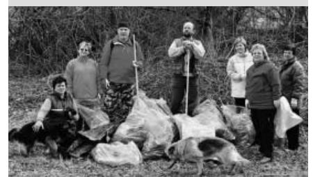
Přátelé country dostali za úkol vyčistit okolí ranče za cihelnou. Jak je zjevné z fotografie, práce měli, tak jako všichni ostatní, až nad hlavu.