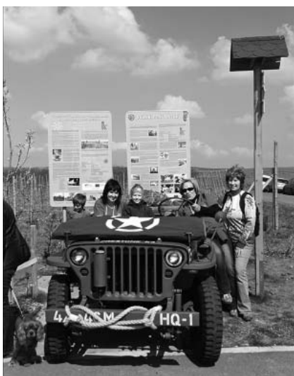
Pod Slunečnou čekalo na účastníky překvapení – vojenské ležení. Automobil z II. světové války uchvátil malé i velké.