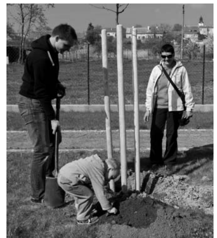
Výsadba mladých stromků rodinami – Šlapka nezapomněla ani na blížící se Den Země.

Ze Slunečné si to většina účastníků prosluněné Šlapky šinula po krásné hladké cyklostezce zpět do městečka, kde se mohla věnovat umění a to hned v několika dimenzích.