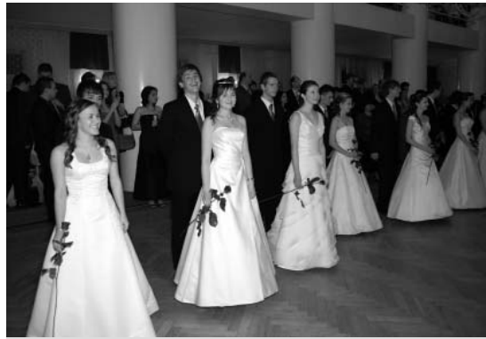
Bez slavnostní „černo-bílé“ polonézy si již nelze Studentský ples ani představit.

V onen den D nás čekaly už jen takové ty „malé starosti“. Upravit nehty, vyžehlit košile, uvázat kravaty, zkrátka hodit se do gala a jít se na to. Všechny dívky měly možnost stát se na jednu noc princeznou, a vypadaly opravdu pohádkově. S přívalem rodičů a návštěvníků plesu se atmosféra stupňovala, ale pro nervozitu v našich hlavách zkrátka