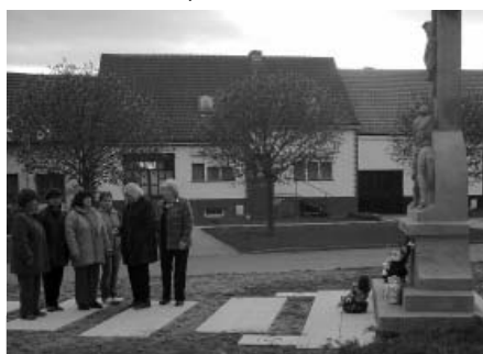
Dámský klub pokládá kytici k pomníku padlých.

Ve čtvrtek odpoledne, dne 14. dubna 2011, se sešly členky velkopavlovického Dámského klubu na Náměstí 9. května, kde položily u pomníku padlých z I. a II. světové války kytici a zapálily svíčku. Tímto krátkým pietním aktem uctily památku padlých z II. světové války. Datum 14. dubna nebylo nahodilé, jednalo se o předvečer 66. výročí osvobození Velkých Pavlovic (15. dubna 1945).