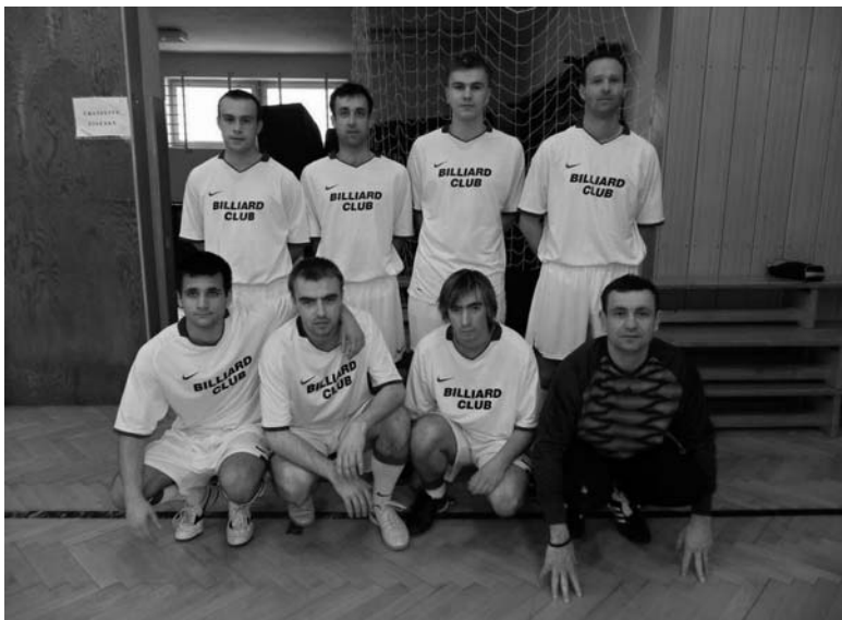
Tým velkopavlovického „Běčka“ obsadil bronzovou příčku modrohorského turnaje.