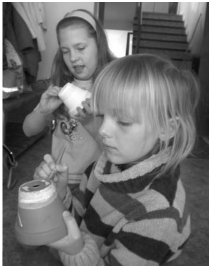
Soustředění a tvůrčí duch...

Úterní odpoledne, dne 22. března 2011, na SVČ proběhlo ve znamení veselého