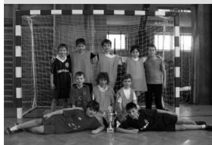
Vítěz starší kategorie – třída 4.A