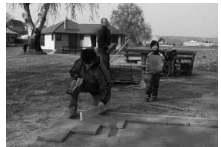
Členové Klubu sportovního rybářství vybudovali v rámci sobotního úklidu nové posezení u rybářské bašty.