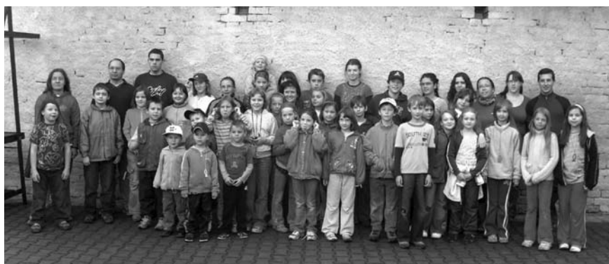
At' je teplo nebo zima, v Těšanech je to vždycky prima!!!

Co s sebou? Jako vždy a ještě kšiltovku, baterku a šátek.