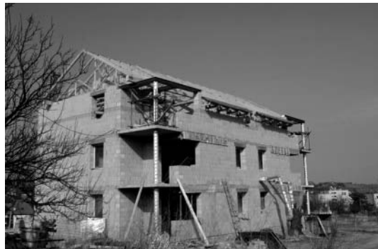
Nová bytová zóna Padělky se rychle rozrůstá, už i třetí bytovka bude brzy pod střechou.

byla zahájena na podzim roku 2010 a dokončena by měla být v květnu 2011. Během měsíce března pracovali zedníci na zdění bytových příček a tesařská firma Růžička se zabývala instalací střešních krovů. Tímto se bytový dům připravoval na další z řady Dnů otevřených dveří, který se uskutečnil 11. března 2011. Případní zájemci tak měli možnost prohlédnout si interiér nové, moderně a vkusně řešené bytovky.