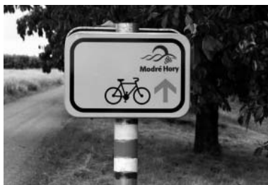
Modré Hory – příjemná cyklotrasa nádhernou vinorodou krajinou naší domoviny. Kdo by odolal...

Jižní Morava je pro cyklisty lákadlem. Aby se všem milovníkům cykloturistiky dobře jelo, začal na podzim r. 2007 existovat vedle skutečného světa jižní Moravy ještě jeden její svět - internetový portál www.cyklo-jizni-morava.cz . V měsíci březnu 2011 byly spuštěny do testovacího provozu jeho aktualizované stránky.