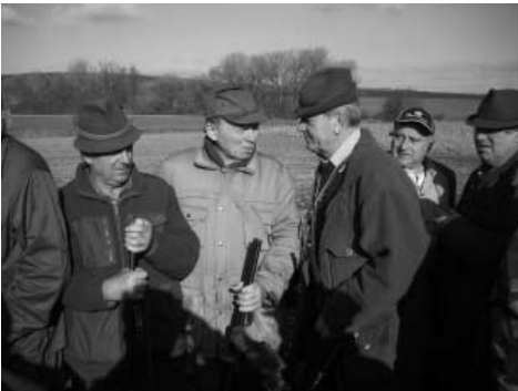
Velkopavlovičtí myslivci na honě.

V sobotu, dne 5. března 2011, se sešli členové Myslivecké jednoty Velké Pavlovice na své výroční členské schůzi, aby zhodnotili svou činnost za uplynulý rok a naplánovali investiční, střelecké i kulturní akce na rok 2011. V tomto roce bude MJ Velké Pavlovice pořádat 3 střelecké závody, dětský den Po stopách pytláka Floriána a Svatohubertskou mši.