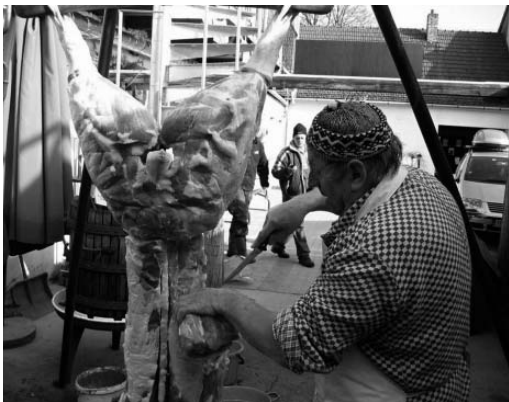
Pravá moravská zabíjačka jak má být!