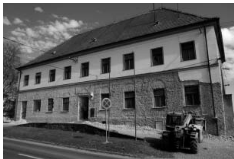
Zámeček před předáním k celkové rekonstrukci. Výsledkem bude nové moderní environmentální centrum, které bude sloužit široké veřejnosti.

Během zimy byly vybourány ze starobylé barokní stavby příčky a všechny další necitlivé vestavby a přístavby v historické budově. Byly vyčištěny půdní i sklepní prostory, podlahy byly odkryty na základní konstrukce. Z fasády byla osekána vlnitá zasolená omítka.