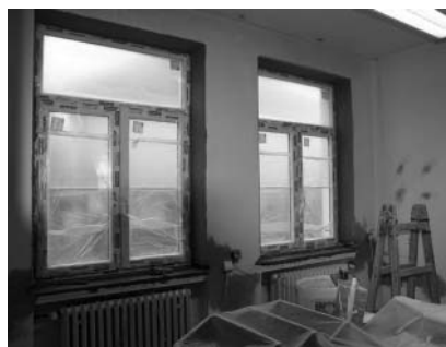
Nová plastová okna nejsou pouze estetičtější, ale především praktická – jsou výborným izolačním prvkem šetřícím energie.

Touto cestou děkujeme všem občanům Velkých Pavlovic a okolí, že jim není lhostejný osud druhých lidí.